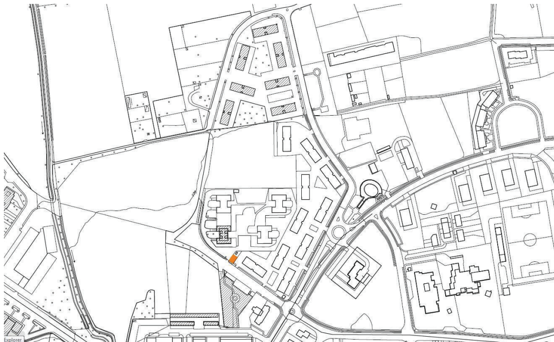
All. 4 planimetria con individuazione dell'area per il Community Organizing