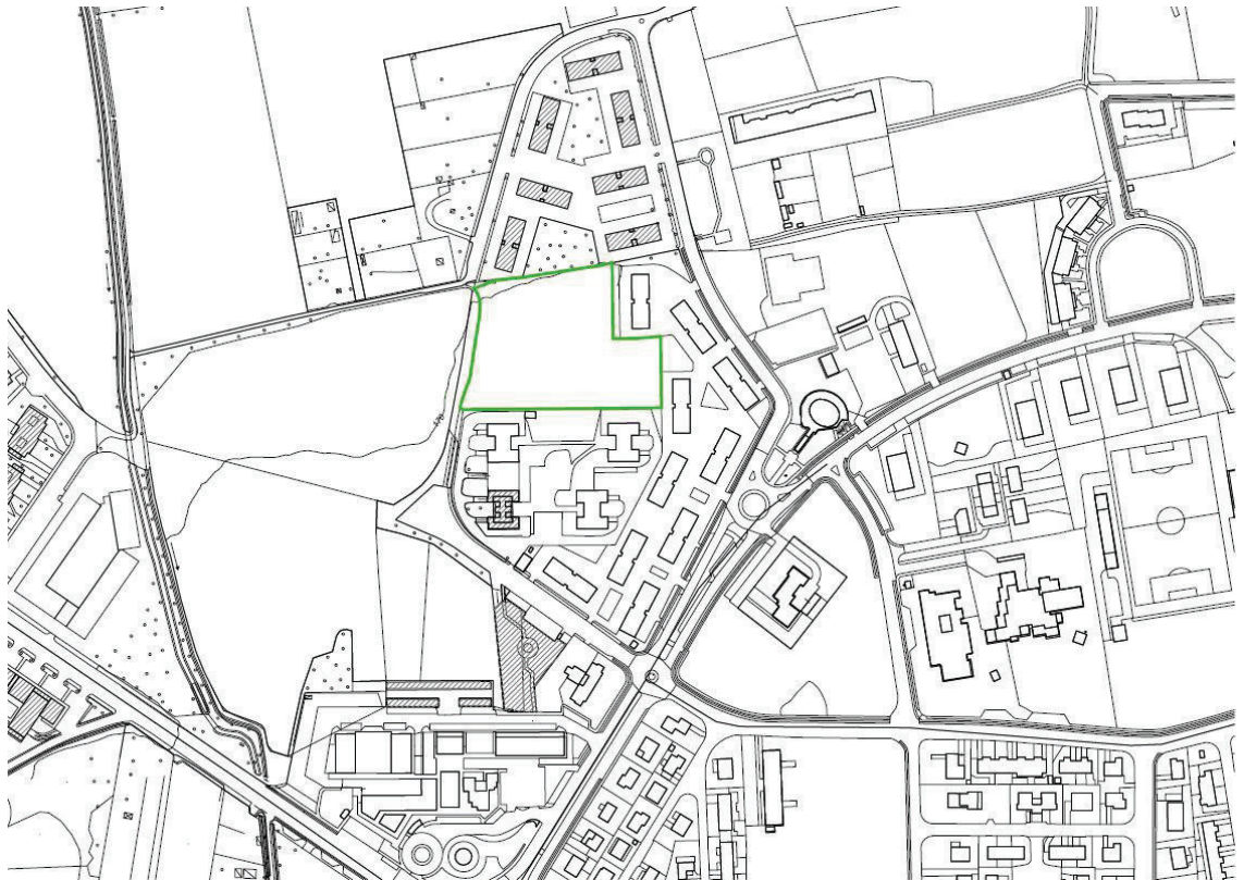
Planimetria Comune di Verdellino (fuori scala)

Allegato 3 - planimetria con individuazione delle aree del Comune di Verdellino per l'intervento di cui all'art. 5